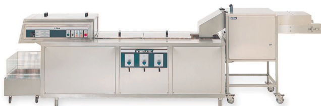
Línea de corte y lavado compuesto de Atirmatic y Stripper II